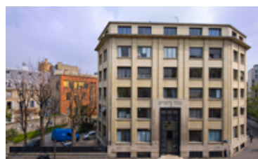
L'EPN Travail, Orientation, Formation, Social sur le site du 41 rue Gay-Lussac, Paris 5e